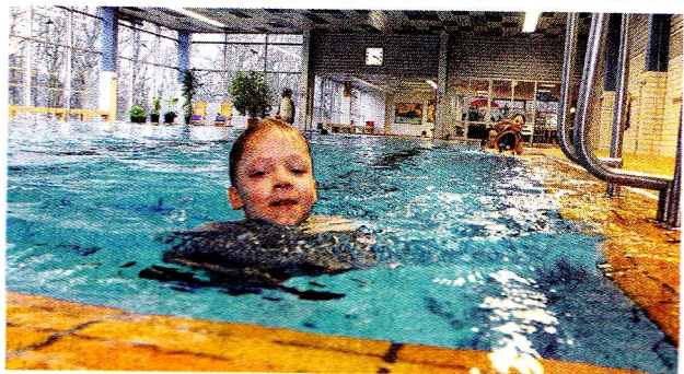
Eine Schwimmhalle reicht, und zwar an der Birkerstraße (oben) – sagt die CDU. Damit würde der Standort Vogelsang (unten) baden gehen.

tuert zu lösen“. Zur Alternative, mit vielen veralteten Bädern weiter zu wurschteln sagt er: „Das wäre dann eher DDR im Kleinen.“ Allerdings hat die CDU im Rat keine Mehrheit. Hier bestimmt die Allianz aus SPD, Grünen, BfS und Linkspartei. „Und die“, sagt Schwenke, „muss jetzt Butter bei die Fische tun.“